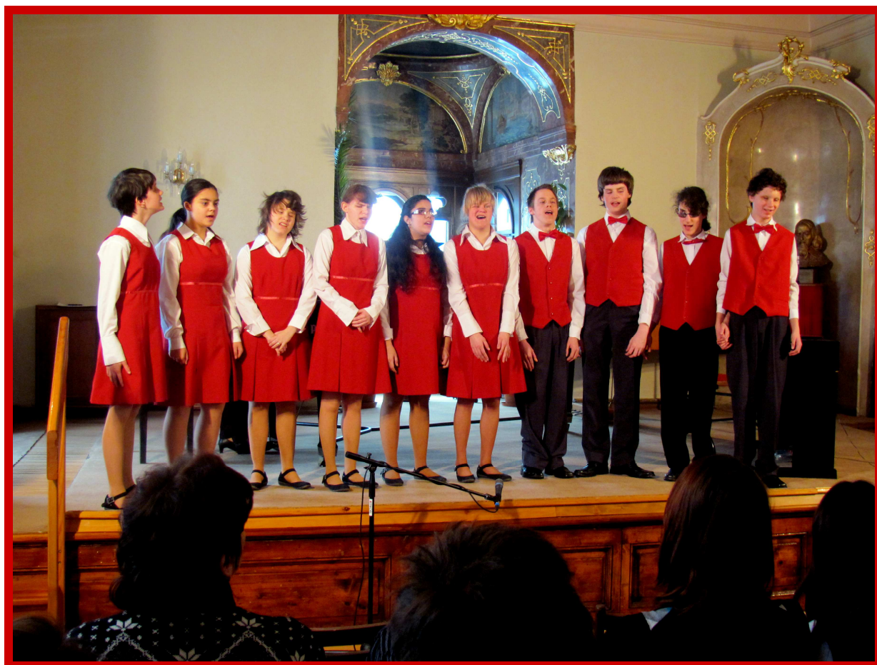
Pěvecký sbor Základní umělecké školy.