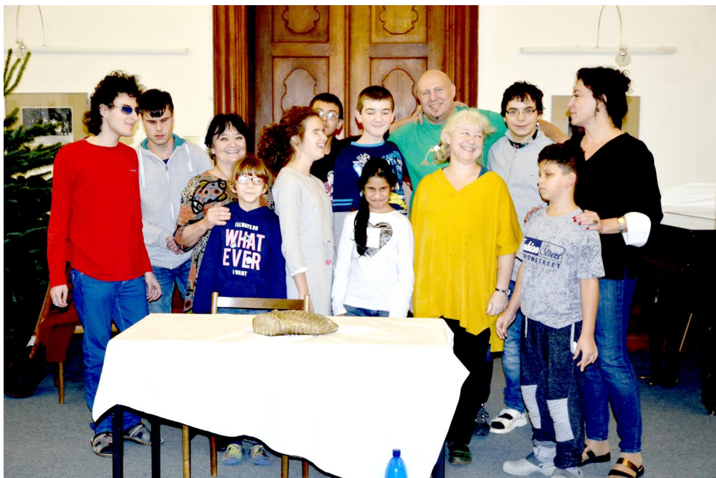
29. 11. navštívila MŠ divadlo U Hasičů, kde žáci zhlédli představení Putování do Betléma .