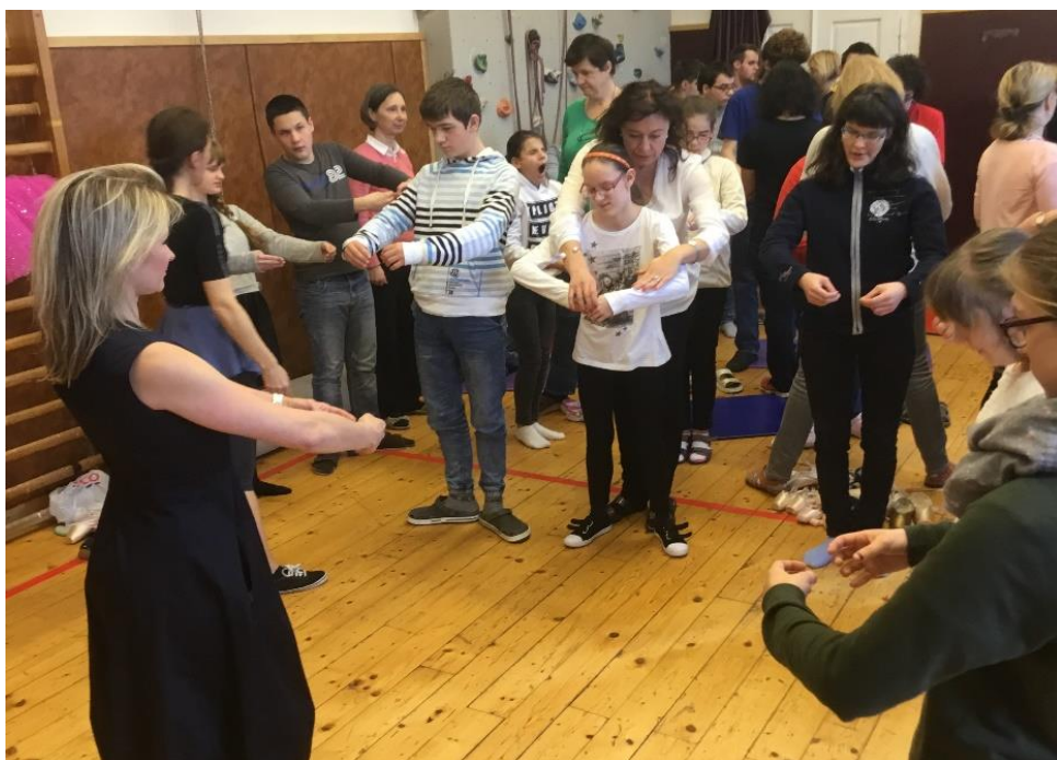
Beseda s baletkou

Dnes 4. 4. 2018 jsme měli ve škole projektový den o Národním divadle. Měli jsme 4 stanoviště a to: vylustění tajenky a hledat na mapě základní kameny, balet, film a kvíz, hádání osobností. Tajenka vyšla: Je to zkrácení nápisu na kasičkách, do nichž se vybíralo na Národní divadlo - NAZDAR. Balet byl v tělocvičně, ale mě moc nebavil.