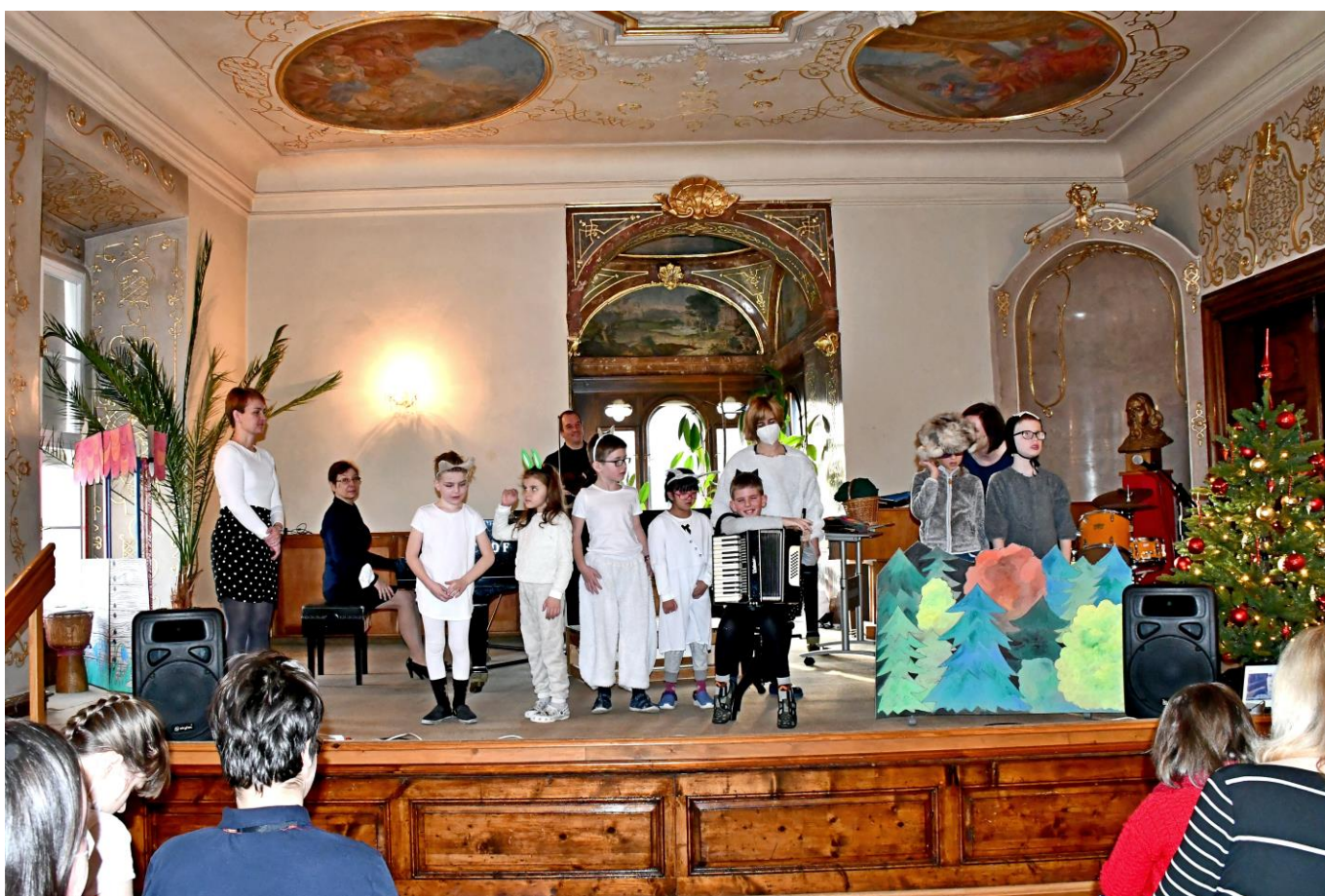
17. 12. proběhlo v sále školy vánoční posezení zaměstnanců školy.